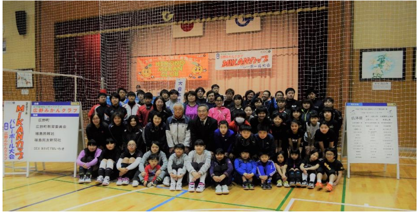
※写真は前回大会の様子です

と き 12月17日(土) 場 所 広野町中央体育館 受 付 8時30分 開 会 式 9時00分 試 合 開 始 9時30分