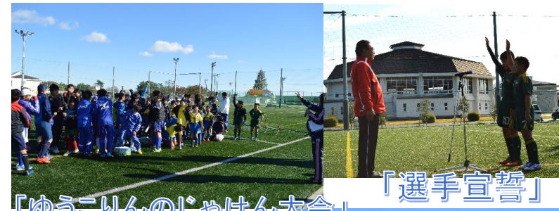
「選手宣誓」 「ゆうこりんのじゃけん大会」

と き 12月2日(土) (小雨決行) 場 所 広野町多目的運動場 部 門 少年の部 混成の部 募 集 数 少年: 8チーム 混成: 8チーム 募集開始 10月23日(月) から 募集締切 11月20日(月) まで。先着順。