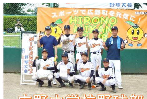
広野中学校野球部