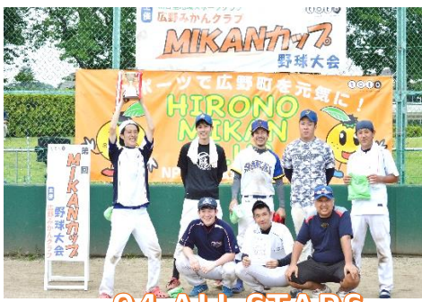
94 ALL STARS