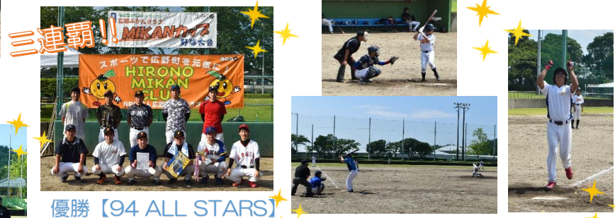
優勝【94 ALL STARS】